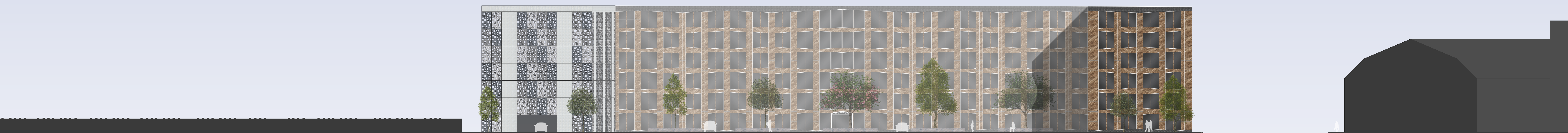
Ansicht von Friedrich-Ebert-Straße 1:200