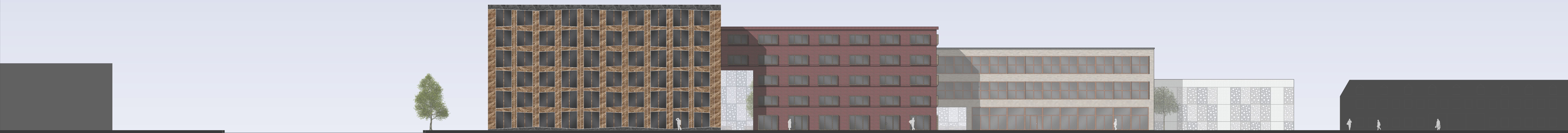
Ansicht von Kaiserstraße 1:200